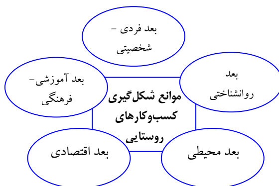
شکل ۱. مدل نظری پژوهش

۴- نظریه توسعه‌یافتگی اقتصادی: این نظریه بر این اصل تأکید دارد که برای کارآفرینی موفق در روستاها، باید به توسعه‌یافتگی اقتصادی توجه کرد. به‌عبارت‌دیگر، باید از روش‌های جدید تولید و تبلیغات استفاده کرد و با ایجاد بازارهای جدید، فرصت‌های جدیدی را برای رشد کسب‌وکارهای روستایی فراهم کرد. بر مبنای پژوهش انجام‌شده در حوزه کسب‌وکارهای روستایی مندرج در جدول ۱، عوامل مختلفی که مانع ایجاد و رشد کسب‌وکارهای روستایی می‌شوند، شناسایی شده‌اند.