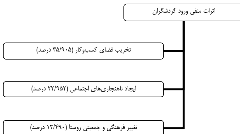
شکل ۳. مدل اثرات منفی ورود گردشگران به روستاهای دهستان ریجاب

عامل‌های مرتبط با اثرات منفی ورود گردشگران به روستاهای دهستان ریجاب در شکل ۳، نمایش داده شده‌اند.